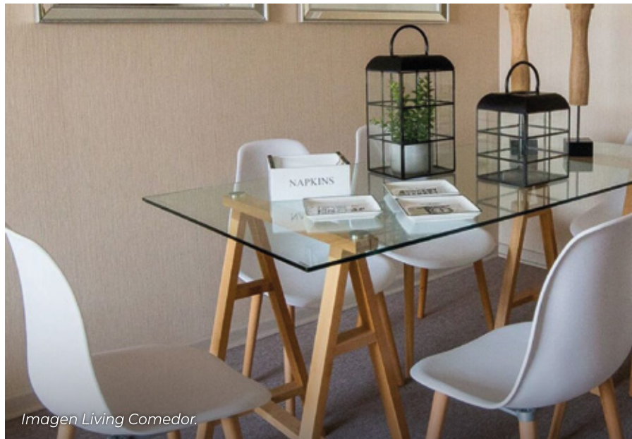
Imagen Living Comedor.