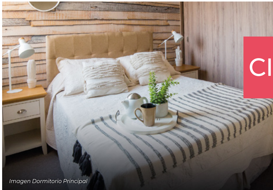
Imagen Dormitorio Principal