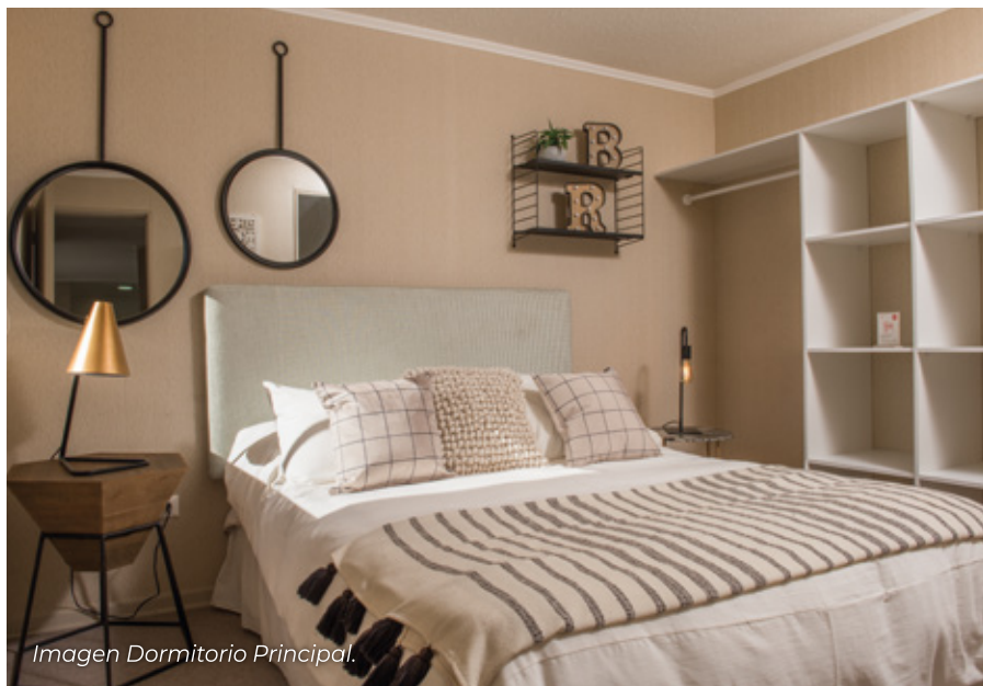
Imagen Dormitorio Principal.